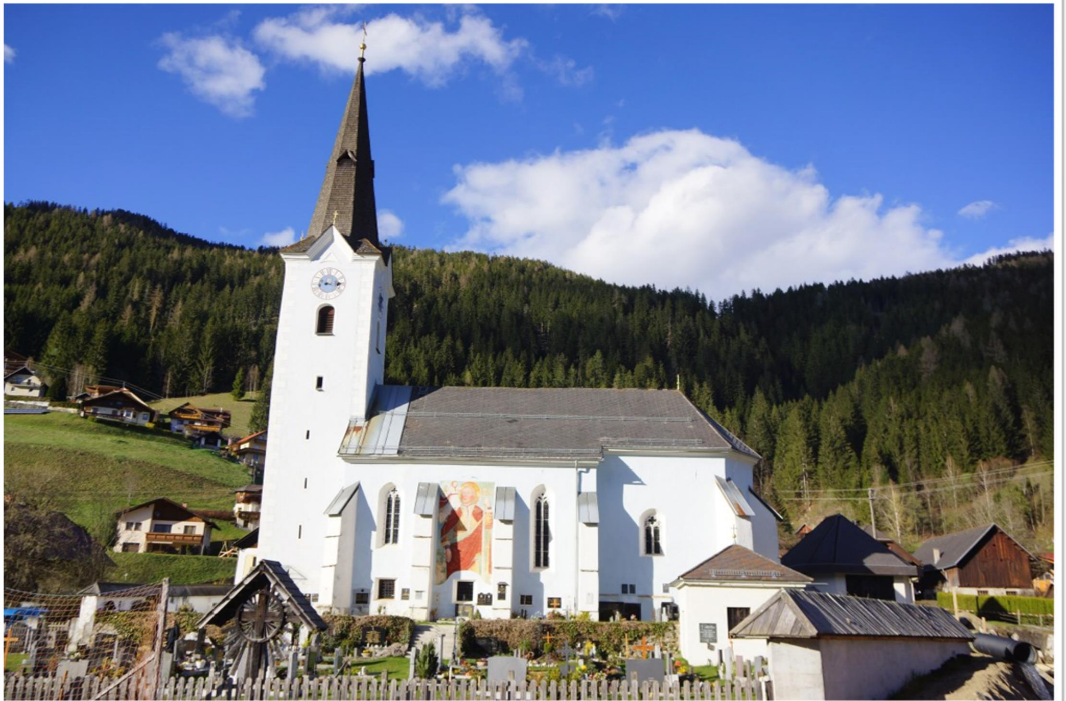
Pfarrkirche St. Margarethen/Reichenau