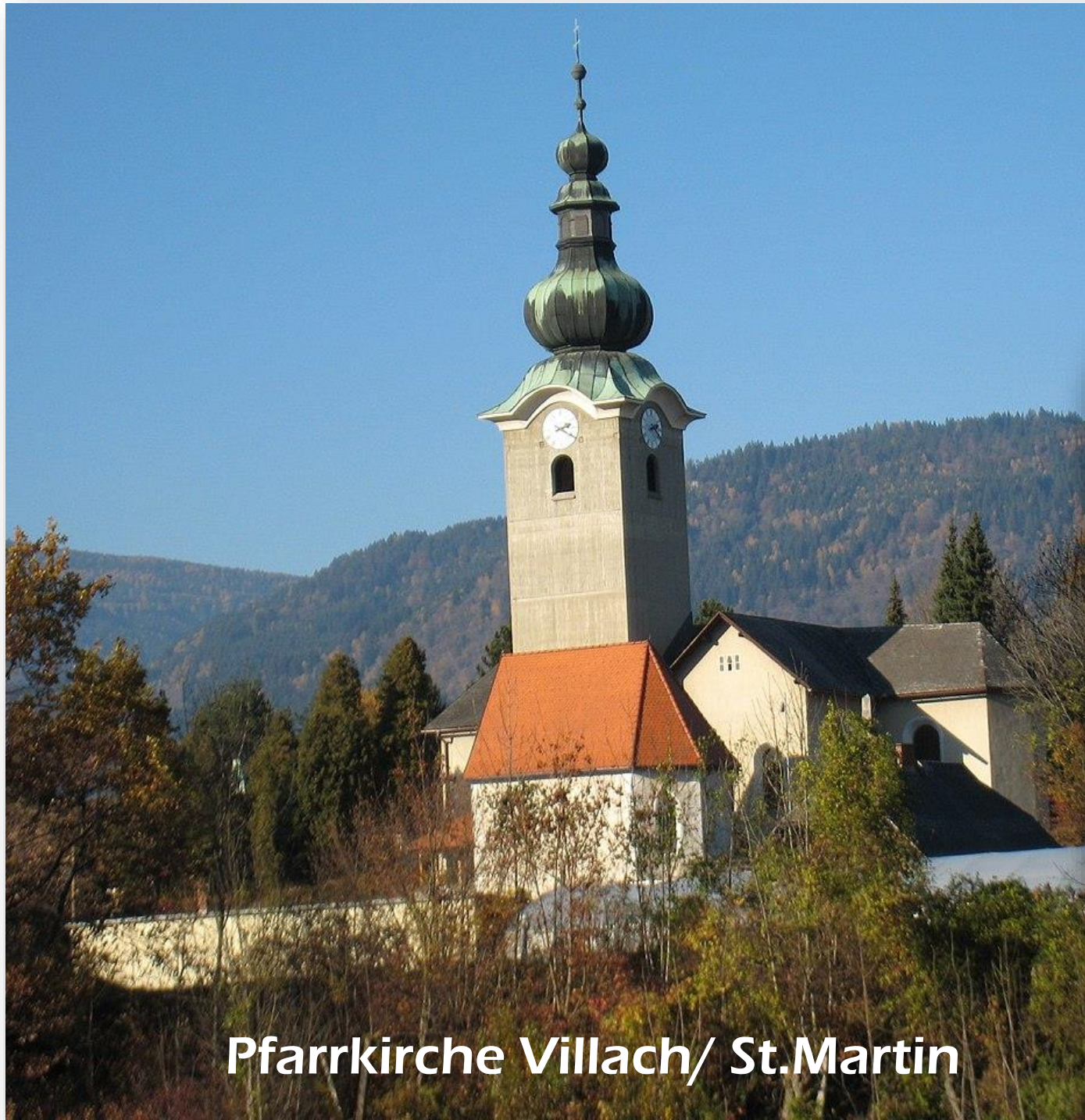
Pfarrkirche Villach/ St.Martin